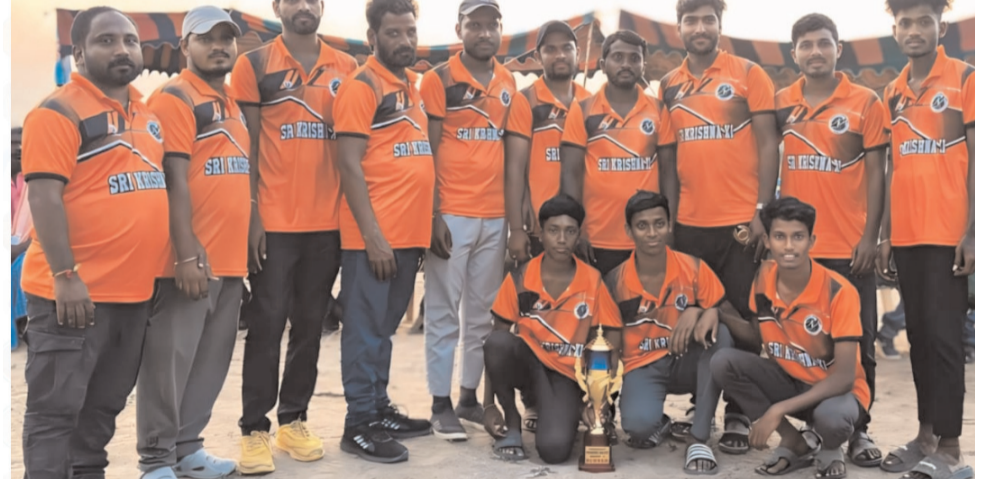
రెండో విజేత శ్రీ కృష్ణ జట్టు