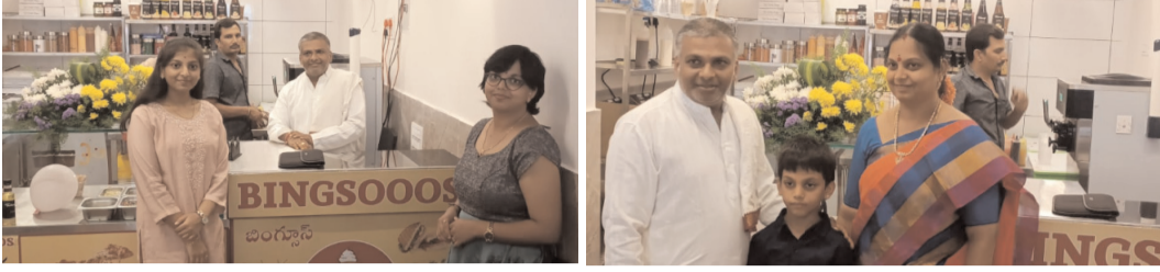
కొత్తపేట, మార్చి 3(నగర నిజం): కొత్త పేట్ డివిజన్ పరిధిలోని ఓమ్మి హాస్పిటల్ సమీపంలో

చందన హెల్త్ ని అనుకోని నూతనంగా ఏర్పాటు చేసిన బింగ్సూస్ (టీటీ యువర్ సెల్స్) పూర్తి వెజిటేరియన్ ఐస్క్రీమ్ పార్లర్ ను యజమాని మేకల పూజ సోమవారం ఘనంగా ప్రారంభించారు. ఈ సందర్భంగా వారు మాట్లాడుతూ, ఇక్కడ ఈ హాట్ సమ్మర్ లో బింగ్సూస్ మిమ్మల్ని వందశాతం కూల్ చేస్తుందిని ఐస్క్రీమ్ పార్లర్ నిర్వాహకులు పూజా తెలిపారు. అన్నిరకాల ఫ్రెష్ ఫ్రూట్ తో సరసమైన ధరలకే అన్ని రకాల ఐస్ క్రీం లు, బర్గర్, పిజ్జా, స్నాక్స్, మిల్క్ షేక్స్ అందుబాటులో ఉంటాయని పేర్కొన్నారు. ప్రామాణికమైన, నాణ్యత కలిగిన రుచి, సుదీర్ఘ కస్టమర్ కి తక్కువ ధరలలో అందిస్తున్నామని తెలిపారు. ఈ కార్యక్రమం లో స్టాఫ్ ప్రజలు, కుటుంబ సభ్యులు తదితరులు పాల్గొన్నారు.