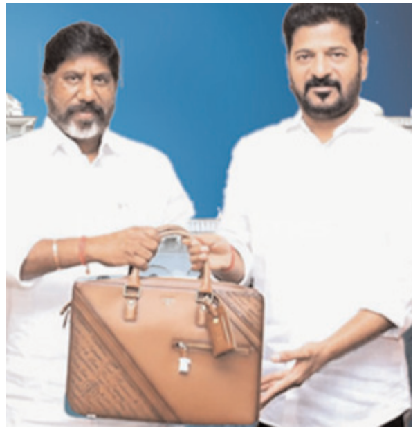
మంత్రివర్గం అసెంబ్లీ కమిటీ హాల్ లో సమావేశమై బడ్జెట్ ప్రతిపాదనలకు ఆమోదం తెలిపి అవకాశం ఉంది.

హైదరాబాద్ /నగరనిజం : తెలంగాణ ప్రభుత్వం నేడు శాసనసభలో 2025-26 ఆర్థిక సంవత్సరానికి సంపూర్ణ బడ్జెట్ ను ప్రవేశపెట్టనుంది. డిప్యూటీ సీఎం, ఆర్థికమంత్రి భద్రీ విక్రమార్క శాసనసభలో, మంత్రి శ్రీధర్ బాబు శాసనమండలిలో బడ్జెట్ ను సమర్పించనున్నారు. ఈసారి రాష్ట్ర బడ్జెట్ రూ.3.05 లక్షల కోట్లుగా ఉండనుందని సమాచారం. గత ఆర్థిక సంవత్సరంలో (2024-25) రూ.2.91 లక్షల కోట్లు ప్రతిపాదించగా, తాజా బడ్జెట్ దాదాపు 5 శాతం అధికంగా ఉండనుంది. దేశవ్యాప్తంగా ఆర్థిక మాంద్యం కొనసాగుతున్నప్పటికీ, రాష్ట్ర ఆదాయ వనరులు, పన్నుల వసూళ్లు, రుణ సేకరణ అవకాశాలను పరిగణనలోకి తీసుకుని వాస్తవిక బడ్జెట్ ను రూపొందించినట్లు తెలుస్తోంది. కీలక రంగాలకు ప్రాధాన్యం ప్రభుత్వం ఈసారి కూడా వ్యవసాయం, వైద్యం, సాగునీరు, విద్య, గ్రామీణాభివృద్ధి వంటి రంగాలకు పెద్దపీట వేయనున్నట్లు తెలుస్తోంది. ముఖ్యంగా, నూతనంగా అధికారంలోకి వచ్చిన కాంగ్రెస్ ప్రభుత్వం ఎన్నికల హామీల్లో భాగంగా ఇచ్చిన ఆరు గ్యారంటీల అమలుకు ప్రాధాన్యం ఇవ్వనుంది. అభివృద్ధి, సంక్షేమం సమన్వయంతో రాష్ట్రాన్ని ముందుకు తీసుకెళ్లాలా ఈ బడ్జెట్ రూపొందించుకుంటోందని ఆర్థిక వర్గాలు పేర్కొంటున్నాయి. ఉదయం 11 గంటలకు అసెంబ్లీలో బడ్జెట్ ప్రవేశపెట్టనున్న నేపథ్యంలో, రాష్ట్ర