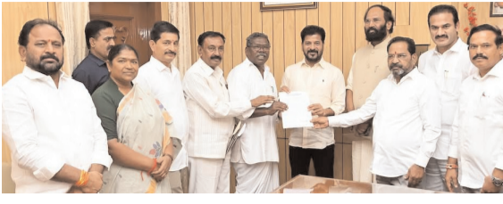
● కోటకొండ,గార్లపాడు గ్రామాలను మండలాలుగా ఏర్పాటు చేయాలి