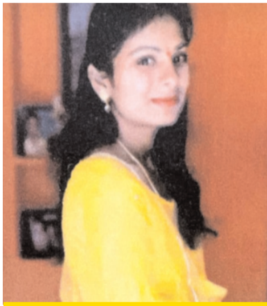
స్వప్న (27) (ఫైల్ ఫోటో)