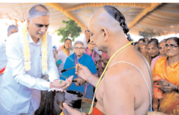
రాజేంద్రనగర్, ఫిబ్రవరి 13(నగరనిజం ప్రతినిధి):రంగారెడ్డి జిల్లా శంషాబాద్ మండలం లోని ముచ్చింతల్ సమతా మూర్తి (స్వాచ్ఛా ఆఫ్ ఈక్వాలిటీ) కేంద్రం ప్రపంచ ఆధ్యాత్మిక కేంద్రంగా మారుతుందని మాజీ మంత్రి హరీష్ రావు ఆశాభావం వ్యక్తం చేశారు. సమ సమాజ నిర్మాణం కోసం రామనాథాచార్యులు చూపిన బాట అందరికీ ఆదర్శమని ఆయన పేర్కొన్నారు. రంగారెడ్డి జిల్లా శంషాబాద్ మండలం లోని ముచ్చింతల్ సమతా మూర్తి కేంద్రంలో సమతా కుంభ 2025 తృతీయ బ్రహ్మాత్సవాలు అంగరంగ వైభవంగా సాగుతున్నాయి. ఫిబ్రవరి 9వ తేదీన మొదలైన బ్రహ్మాత్సవాలు ఈనెల 19 కొరకు కొనసాగుతున్నాయి. ఈ నేపథ్యంలో గురువారం నాటికి సమతా కుంభ బ్రహ్మాత్సవాలు ఐదవ రోజుకు చేరుకున్నాయి. ఐదో రోజు బ్రహ్మాత్సవాల సందర్భంగా స్వామివారు వివిధ రూపాల్లో భక్తులకు దర్శనమిచ్చారు. ఐదవ రోజు జరిగిన వేడుకలకు మాజీ మంత్రి హరీష్ రావు హాజరయ్యారు. ఈ మేరకు హరీష్ రావుకు చిన్న జీయర్ స్వామి మంగళా శాసనాలు అందజేశారు. ఆ తర్వాత యగ్గశాలకు చేరుకున్న హరీష్ రావు అర్చకులు కంకణ దారణ చేశారు. ఈ సందర్భంగా సమతా మూర్తి కేంద్రంలో స్వామివారికి ప్రత్యేక పూజలు నిర్వహించిన మాజీ మంత్రి హరీష్ రావు... ఆ తర్వాత తీర్థ గోష్ఠిలో పాల్గొన్నారు. ఈ సందర్భంగా హరీష్ రావు కు త్రిదండి చిన్న జీయర్ స్వామి తీర్థప్రసాదాలు అందజేశారు. ఈ సందర్భంగా మాట్లాడిన హరీష్ రావు... శంషాబాద్ సమీపంలోని సమతామూర్తి కేంద్రం ఒక గొప్ప ఆధ్యాత్మిక కేంద్రంగా వర్ధిల్లడం ఖాయమని ఆశాభావం వ్యక్తం చేశారు. ప్రపంచానికి మార్గం నిర్దేశం చేసే విధంగా త్రిదండి చిన్న జీయర్ స్వామి సారధ్యంలో ఏర్పాటైన స్వాచ్ఛా ఆఫ్ ఈక్వాలిటీ కేంద్రం హైదరాబాద్ కు ఒక ల్యాండ్ మార్ఫ్ కానుందన్నారు. సమతా కుంభ తృతీయ బ్రహ్మాత్సవాలు అంగరంగ వైభవంగా సాగుతుండడం పట్ల హరీష్ రావు ఆనందం వ్యక్తం చేశారు. ప్రతి ఒక్కరూ చిన్న జీయర్ స్వామి మార్గ నిర్దేశంలో భక్తి మార్గంలో పయనించాలని ఆయన పిలుపునిచ్చారు.