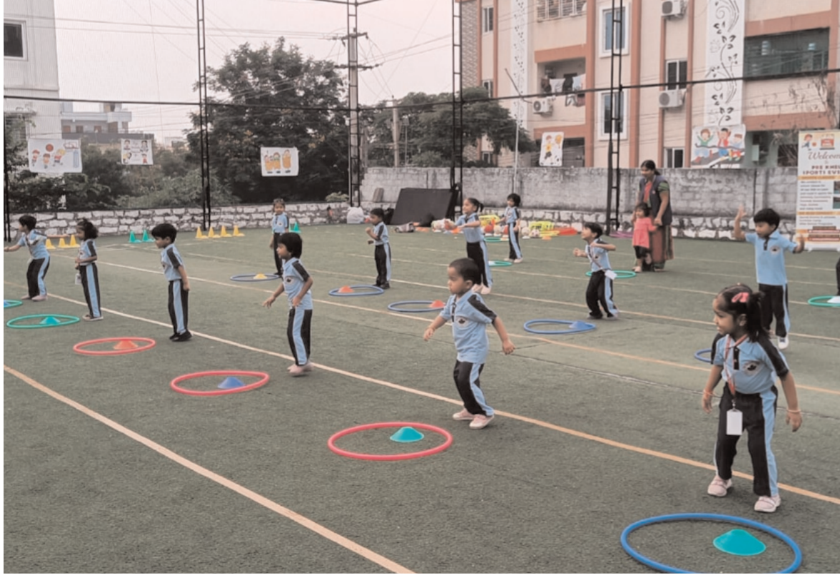
తల్లిదండ్రులు పెద్ద ఎత్తున పాల్గొన్నారు.

తల్లిదండ్రులు కూడా పెద్ద ఎత్తున పాల్గొని పిల్లలను ప్రోత్సహించారని అన్నారు. స్పోర్ట్స్ డే అనంతరం గెలిచిన పిల్లలకు బహుమతులు ప్రధానం చేశారు. తదనంతరం స్పోర్ట్స్ కంపెనీ ప్రీ ఖేల్ నిర్వాహకులు మాట్లాడుతూ తాము స్కూల్స్ కి చేస్తామని అన్నారు. అనంతరం ఈ స్కూల్ లో చదువుతున్న పిల్లలు ఈ స్కూల్ నిర్వాహకులు సొంత కుటుంబ సభ్యులగా చూసుకుంటారని, చదువుల్లో ఆటల్లో పిల్లల్ని ఎంతో ప్రోత్సహిస్తారని పిల్లల తల్లిదండ్రులు తమ అభిప్రాయాలను తెలియజేశారు. ఈ కార్యక్రమంలో స్కూల్ సిబ్బంది, విద్యార్థుల