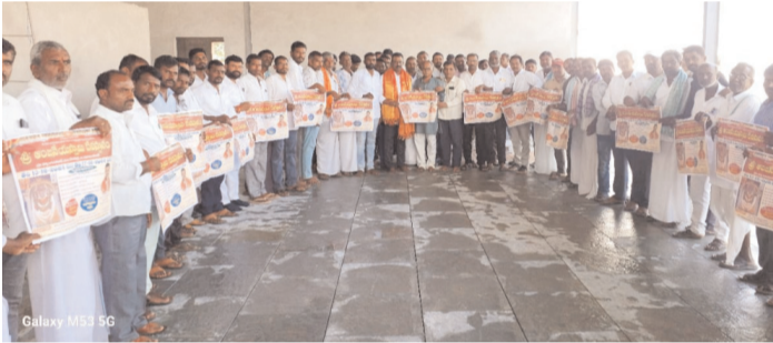
అర్చకులు,సిబ్బంది,కమిటీ సభ్యులు మరియు గ్రామ పెద్దలు ప్రజలు పాల్గొన్నారు.