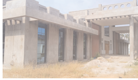
డివిజన్ కార్యాలయాన్ని పూర్తి చేయాలని, తూప్రాన్ డివిజన్,తాసిల్దార్ కార్యాలయంలో వసతులు లేకపోవడం ఇలా చెప్పుకుంటూ పోతే ఎన్ టి ఓ కార్యాలయం ఇరిగేషన్ తదితర శాఖ కార్యాలయాలు ప్రైవేట్ గా నడుస్తున్నాయి ప్రతిఘటన పూర్తి చేస్తే అన్ని ఒకే దగ్గర ఉంటాయని మీడియాతో తెలిపారు.

కొన్ని నెలల్లో పూర్తిచేయండి : తూప్రాన్ ఆర్ డి వై జై చంద్రారెడ్డి.