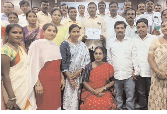
సంక్షేమ శాఖ తరఫున అమలు అవుతున్న పథకాలను దివ్యాంగులు సద్వినియోగం చేసుకోవాలని కోరారు.జిల్లా వికలాంగుల సంఘం అధ్యక్షులు సర్పంచారి మాట్లాడుతూ.. అన్ని కార్యాలయాలలో వారికి వసతులు కల్పించాలని, అదే విధంగా సదరం సర్టిఫికేట్ ల జూరిలో జాప్యం జరగకుండా చూడాలని పిడి డీఆర్ఐవిను కోరారు. ఈ కార్యక్రమంలో శాఖ అధికారులు, తదితరులు పాల్గొన్నారు.

● జిల్లా గ్రామీణభివృద్ధి శాఖ అధికారి శ్రీలత