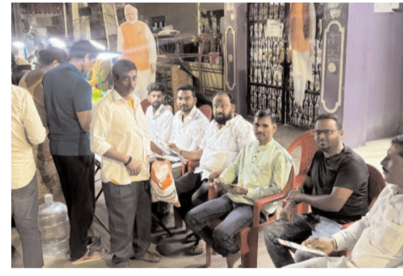
ప్రశాంత కాలనీ వాసులుతదితరులు పాల్గొన్నారు.