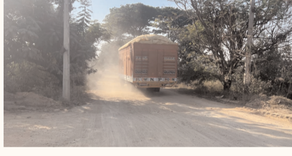
భారీ వాహనాల వెంట వస్తున్న దూలిని భరించలేకపోతున్న వాహనదారులు