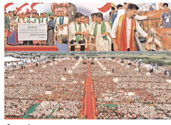
సీఎం రేవంత్ రెడ్డి సీమాంధ్ర సీఎంలు అన్యాయం చేసిందన్నవ్.. పాలమూరుకు నువ్వెట్ల అన్యాయం చేశావ్ కేసీఆర్!

పాలమూరు కరువు పారడ్రోలేలా అభివృద్ధి చేస్తా భూసేకరణలో ఎకరాకు రూ.10 లక్షలు కాదు.. రూ.20 లక్షలు ఇస్తా రైతు పండుగ ముగింపు వేడుకల్లో ముఖ్యమంత్రి రేవంత్ రెడ్డి మహబూబ్ నగర్, నవంబర్ 30 (విజయక్రాంతి): పాలమూరు జిల్లాకు సంవత్సరానికి రూ.20వేల కోట్లు ఇవ్వేందుకు మంత్రిమండలిని అడుగుతున్నానని.. ఇలా ఐదేండ్లలో లక్ష కోట్లు ఖర్చు చేస్తే జిల్లా అంతా పంటలు పండుతాయని ముఖ్యమంత్రి రేవంత్ రెడ్డి చెప్పారు. పాలమూరు తలరాత మారుస్తానని తెలిపారు. ఉమ్మడి మహబూబ్ నగర్ జిల్లాలో కృష్ణా నది పారుతున్న ప్రజల కష్టాలు తీరలేదని.. 70 యేండ్లు కన్నీళ్లతో బతికామని అన్నారు. కేసీఆర్ కాశేశ్వరం ప్రాజెక్టుకు రూ.1 లక్ష 2 వేల కోట్లు తీసుకుపోయానా, కట్టింది కుప్పకూలిందని చెప్పారు. నెహ్రూ కట్టిన నాగార్జున సాగర్, శ్రీశైలం, జూరాల, శ్రీరాంసాగర్, శ్రీవాడ ఎల్లం సాగర్ ప్రాజెక్టులు ఎన్ని వరదలు వచ్చినా వ్యవసాయానికి, తాగునీరుకు చెక్కుచెదరకుండా నీరు అందిస్తున్నాయని తెలిపారు.